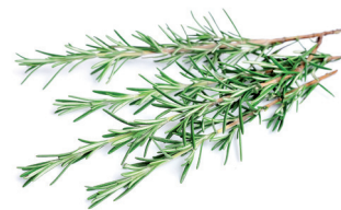
rosmarino azione antibatterica