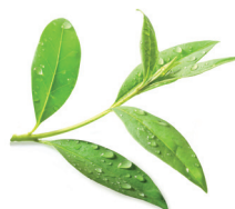
tea tree oil azione antibatterica