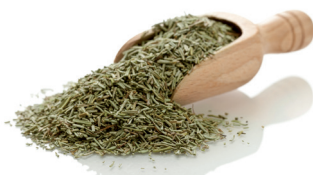
timo azione antibatterica