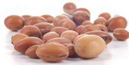
olio di Argan lenisce e ripara