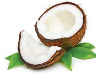
cocco nutre il pelo