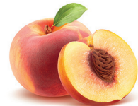
pesca lenisce la cute